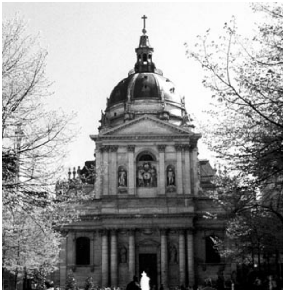
De Sorbonne in Parijs