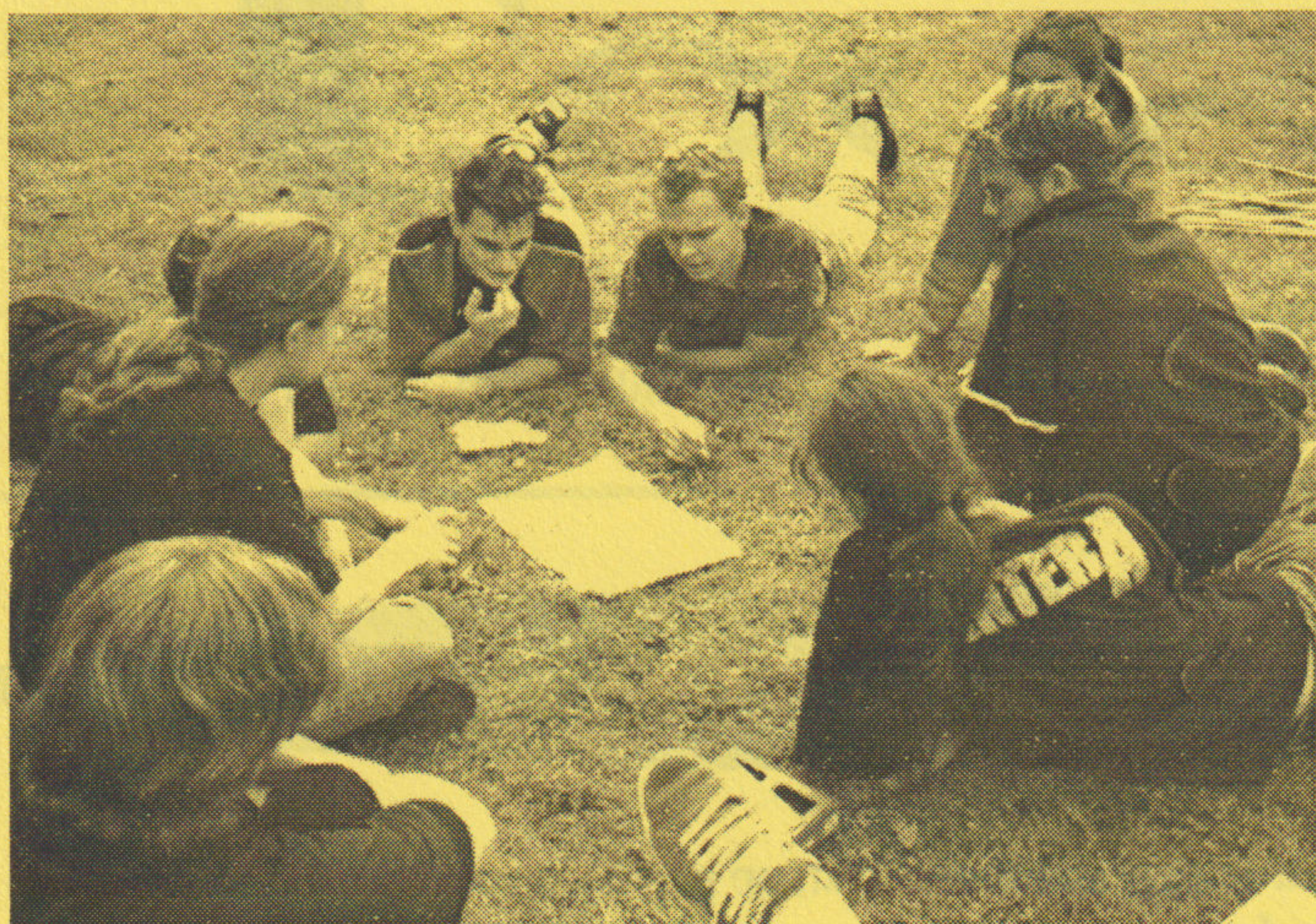
Er heerst een gespannen stilte in het land der filosofen.....