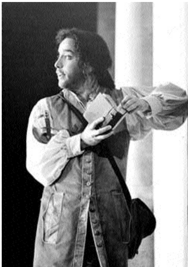
Leporello met het beruchte register

Tot woede van Don Elvira laat Leporello zien hoeveel vrouwenharten zijn meester heeft gebroken de laatste tijd, waar het gebeurd is, wat zijn voorkeuren zijn en noem maar op.