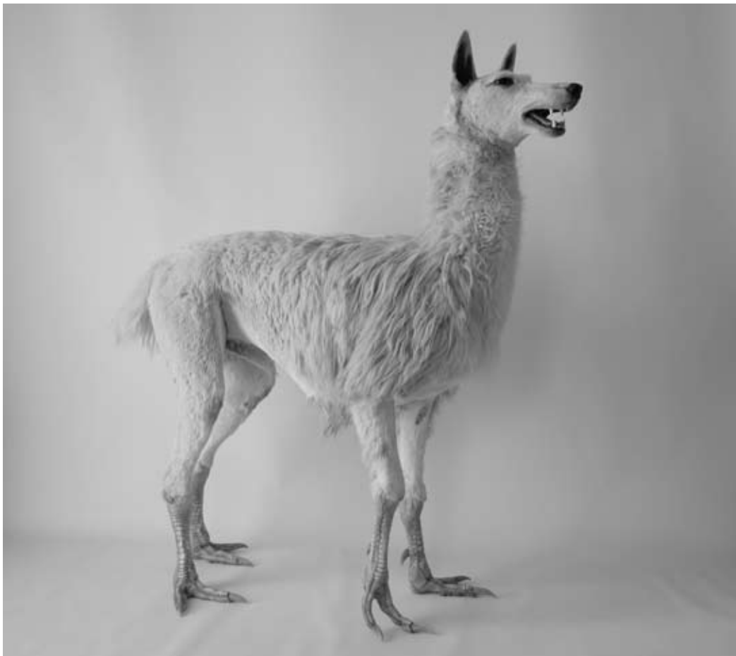
Ridable, 2008, 156cm x 51cm x 150cm, Taxidermy

Van 28 februari tot 7 juni 2009 is de expositie 'The Islanders: An introduction' te zien, te lezen en te onderzoeken in het Museum Boijmans Van Beuningen in Den Haag. Tip: op woensdag is het museum gratis toegankelijk.