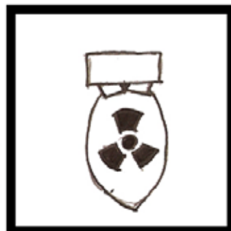
2. Nuclear Bomb