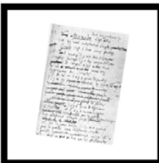
3. Leibniz' Monadology