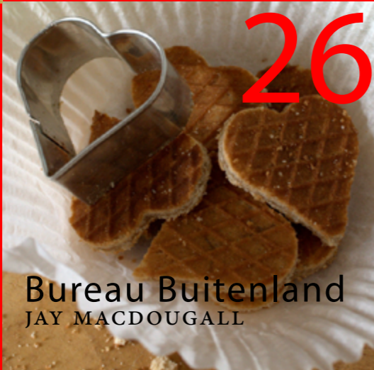
26 Bureau Buitenland JAY MACDOUGALL